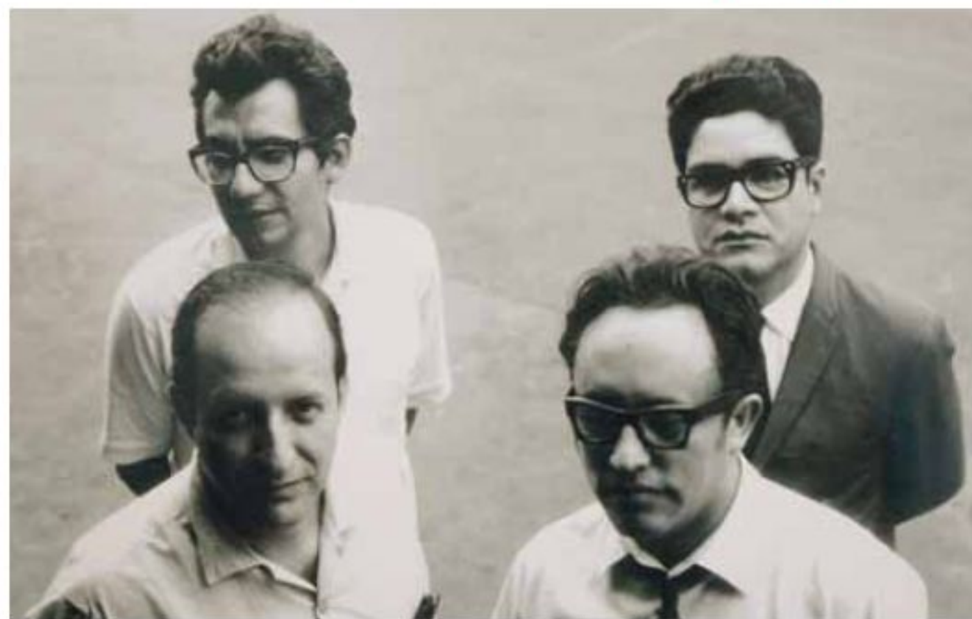
EPOCA DE ORO. Los músicos en sus años mozos cuando comenzaban a destacar por su arte.

Somos productos de una realidad, casi representamos a las tres regiones del Perú: yo, costeño; Valcárcel, del altiplano, y Pulgar Vidal, de Huánuco, ceja de selva. El Perú es muy complejo.